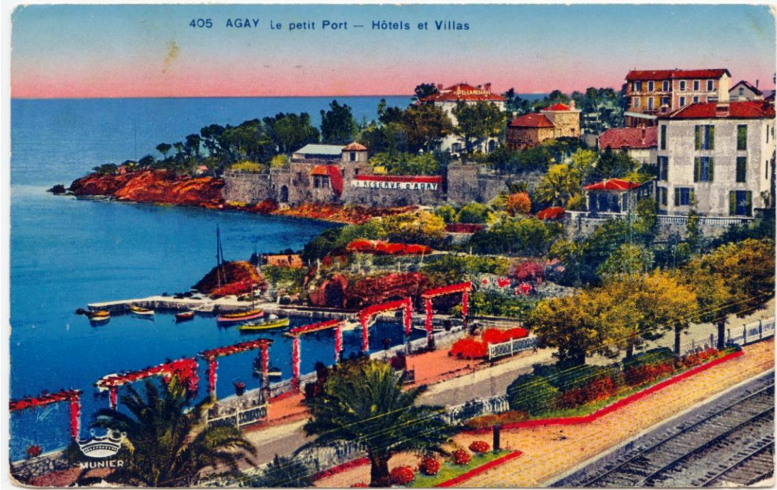
405 AGAY Le petit Port — Hôtels et Villas