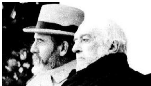
Lord Rendel et Lord Gladstone

En 1880 il choisit la politique : élu député Libéral du Pays de Galles, il en est vite le leader. En 1894 son amitié avec le premier ministre de la Reine Victoria, William Gladstone, lui permet d'obtenir le titre de Baron de Hatchlands (Surrey) et de siéger à la chambre des Lords.