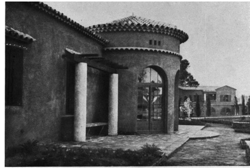
Un pavillon dans la propriété « la Terrasse », à Boulouris-sur-Mer. René Darde, architecte.

Il l'agrandit avec l'architecte René Darde, et ajoute un garage automobile, un garage à bateaux puis la terrasse en bord de mer. René Darde réalise en même temps la transformation de l'ancien poste de douane limitrophe en pavillon habitable.