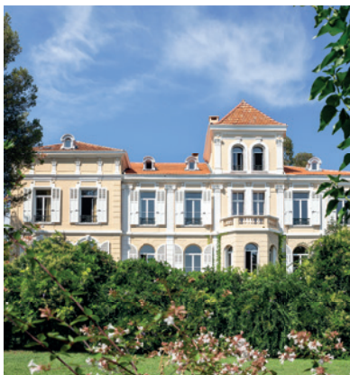
Villa Les Myrtes

Vingt panneaux illustrés jalonnent ce circuit afin de mettre en valeur un patrimoine architectural exceptionnel souvenir d'un riche passé et témoignant de l'histoire de Saint-Raphaël, ville attractive où nombreux choisirent d'y construire ces splendides demeures.